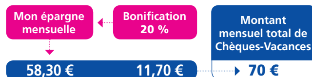
Tableau N°2 : Barème d'épargne mensuelle.

« Mariée, deux enfants (3 parts fiscales), mon revenu fiscal de référence est de 28 020 €, je peux donc bénéficier d'une bonification de 25% »